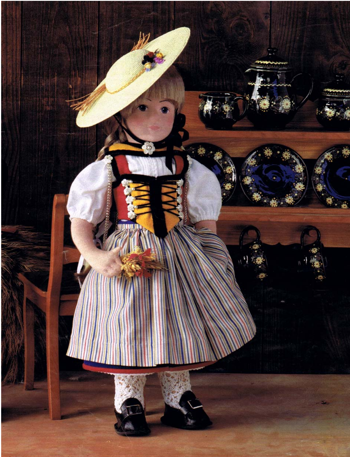
20 Costume Freudenberger de villageoise