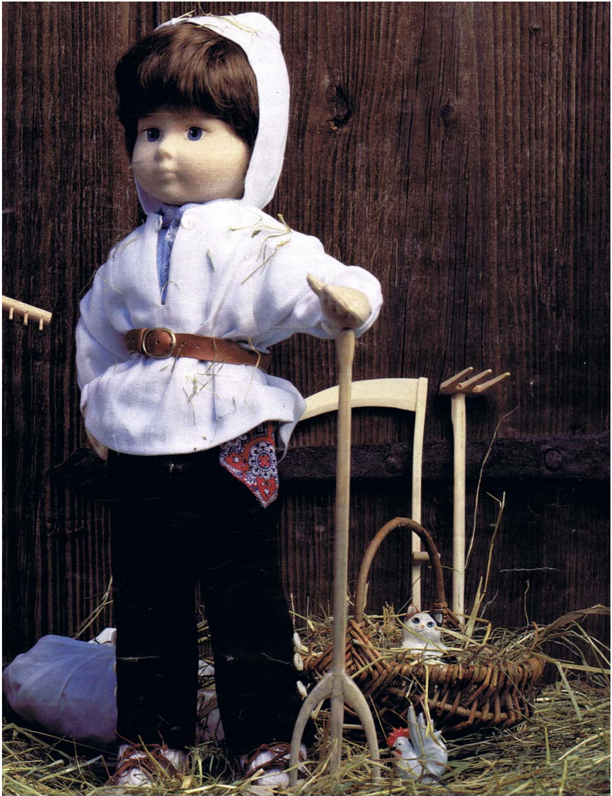
5 Costume de paysan ou de berger